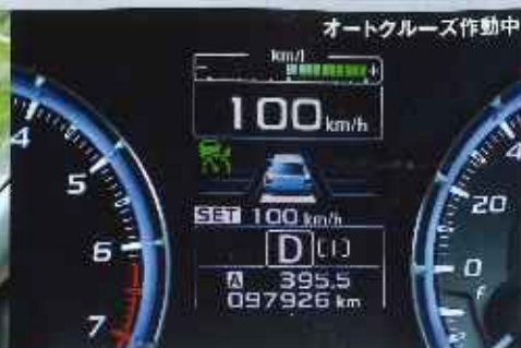
オートクルーズ作動中